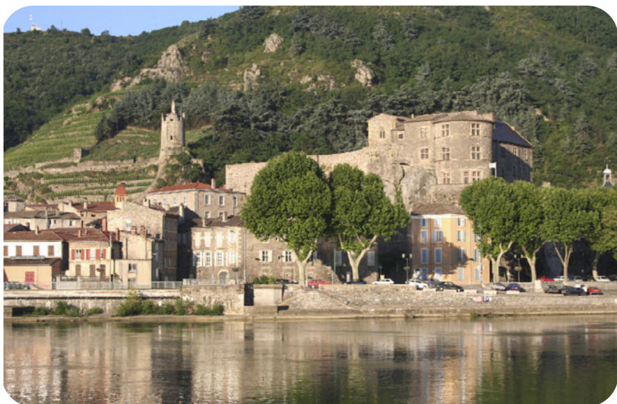
▲ Le coteau Saint-Joseph, à Tournon, qui donne son nom à l'appellation.

☞ La palme de l'élégance, mais aussi de la longévité, revient au domaine Guigal ,